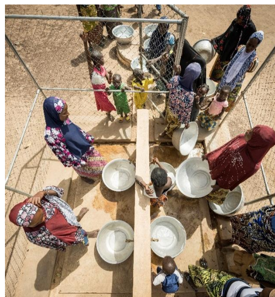
Les femmes du village de Toumarou, visages rayonnants utilisant la source d'eau réalisée dans le village par Helvetas .

Le SIGE a soutenu la phase précédente du projet qui a permis de mettre en lumière des expériences réussies dans les écoles, avec le concept d'écoles bleues notamment, ainsi que dans les centres de santé. En parallèle de la réalisation d'infrastructures, l'objectif est maintenant d'élargir ces approches, d'en évaluer l'impact non seulement au sein des écoles et des centres de santé, mais aussi au niveau communautaire, et de favoriser l'appropriation par les autorités publiques. C'est ainsi que les populations vulnérables pourront avoir accès à des services d'eau et d'assainissement fiables, de manière durable.